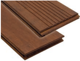
Striée / Lisse Sikkens Ipé (lame réversible) BO-DTC171G-01